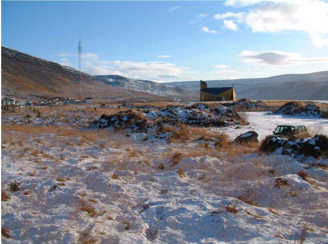
Horft yfir "Hótelgrunn" að Kirkjunni