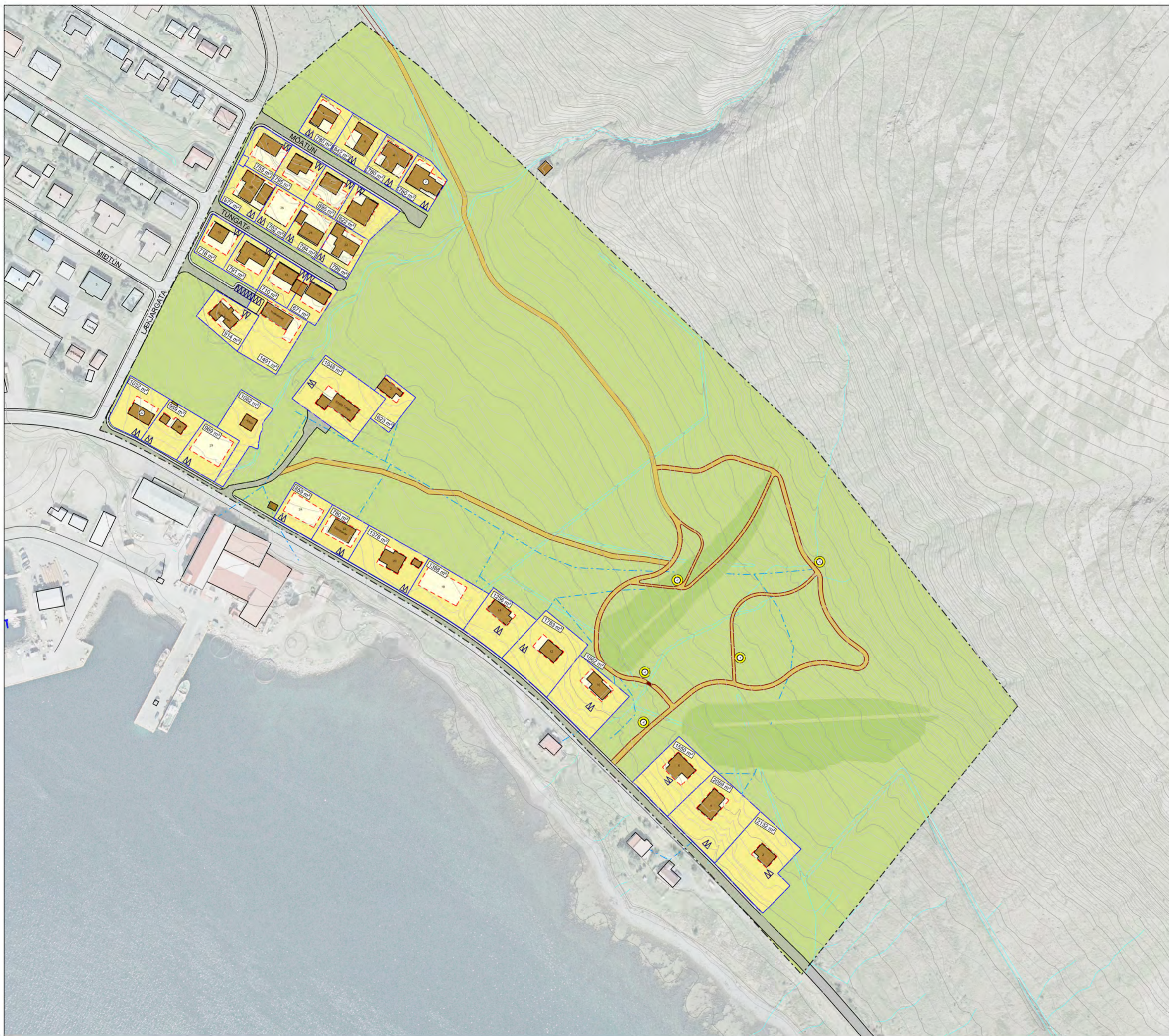
Deiliskipulagsuppráttur. Mkv. 1:2000