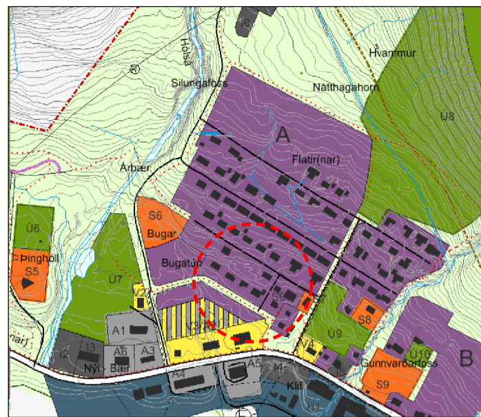
Hluti af Aðalskipulagi Tálknafjarðar 2006-2018